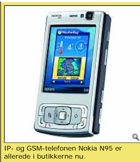
IP- og GSM-telefonen Nokia N95 er allerede i butikkerne nu.

"Dette er en af grundene til at teleselskaberne frygter bredbåndstelefonti. Det er nemlig store summer vi taler om. De store teleselskaber, der ejer kablerne og GSM licenserne, har typisk en meget høj fortjeneste og det kan